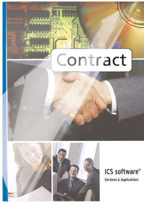
Átlátszó elő és matt hátoldal