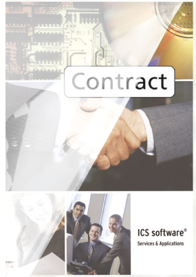
Matt elő és átlátszó hátoldal