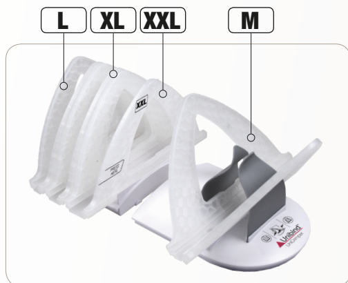
Az UniCrimper M kibővíthető L, XL, XXL mérettel.